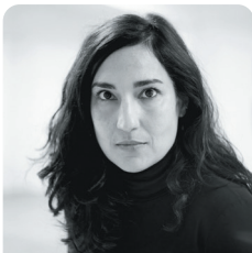
Argyro Chioti Metteuse en scène, comédienne