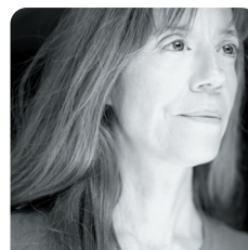
Catherine Germain Comédienne