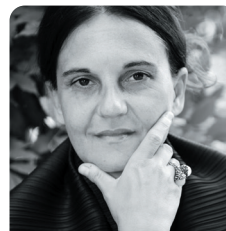
Emma Dante Metteuse en scène, réalisatrice