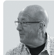
Jean-Pierre Ryngaert Dramaturge, professeur des universités (émérite en septembre 2011) à l'Université Paris III

Dans l'enseignement de la dramaturgie, il s'agit d'éclairer textes et contextes en relation étroite avec le travail du plateau, de repérer des lignes directrices dans le jeu, de susciter des curiosités et d'être attentif à l'évolution des formes théâtrales, y compris les plus récentes, sur les scènes et dans les écritures. J-P.R.